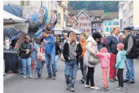
Schon gestern Vormittag zeigte sich wieder das für den Siebner Märt übliche Bild mit zahlreichen Besuchern.